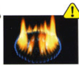
酸素不足 又はバーナー 内のつまり